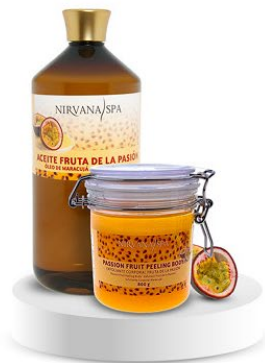
Peeling body 800 g. Ulei de masaj 1litru.