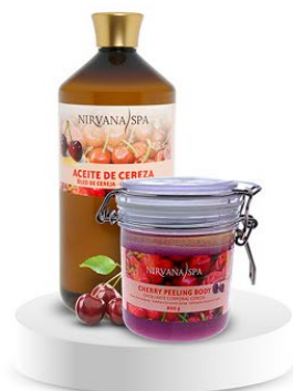
Peeling body 800 g. Ulei de masaj 1litru.

Vrei să te bucuri de toate Ritualurile Spa acasa?