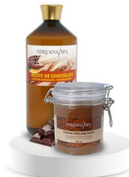
Peeling body 500 ml. Ulei de masaj 1litru.