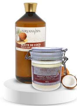
Peeling body 800 g. Ulei de masaj 1litru.